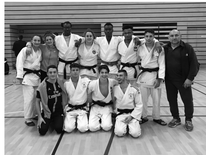
Pôle Universitaire BFC (Besançon + Dijon)